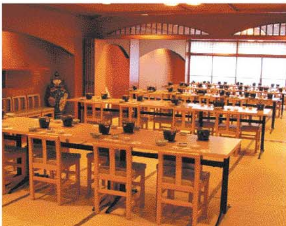
大広間での宴会もテーブル席でラクラク。 最大で100名様までの宴会が可能です。

ちょっと贅沢な1ランク上の宴会を磯太郎自慢の「とらふぐコース」でお楽しみください!