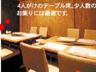
4人がけのテーブル席。少人数のお集りには最適です。